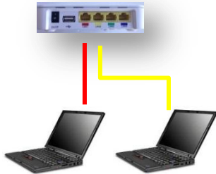
Alternativ 2 Två datorer uttag 1 (röd), uttag 2 (gul)