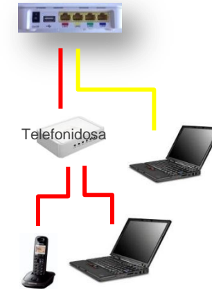
Alternativ 2 Två datorer + telefon uttag 1 (röd), uttag 2 (gul)