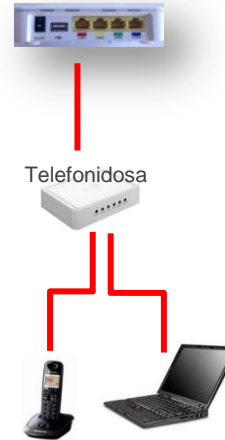
Alternativ 1 En dator + telefon uttag 1 (röd)