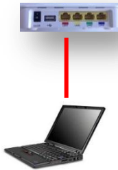
Alternativ 1 En dator uttag 1 (röd)